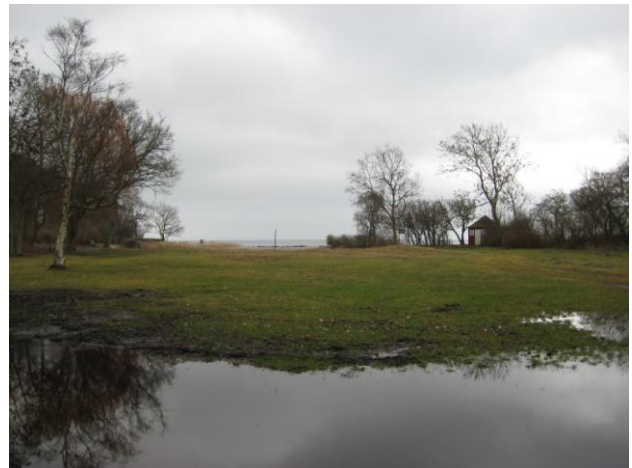
Guldborgsund kommune: Skansen ved Nysted