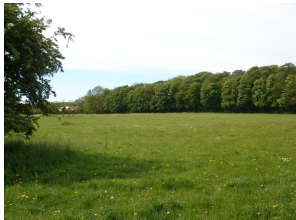
Lolland Kommune: Engen ved Kidnakken, ved siden af frilandsmuseet