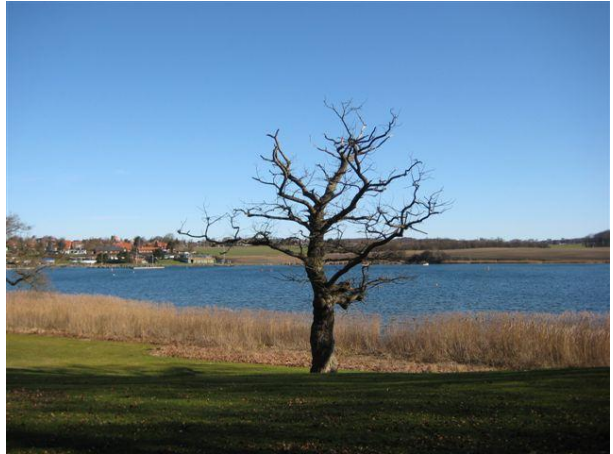
Vordingborg Kommune: Oringe ved Tehuset